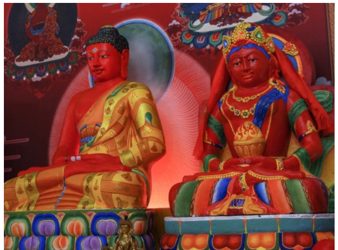
Sanador Supremo Amitaba Pandavarsini (Gran Madre Fuego)